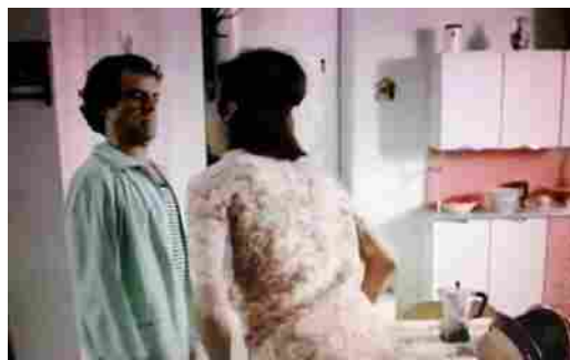
'Ti spunta un fiore in bocca...', celebre battuta dal film 'Febbre da cavallo' di Steno