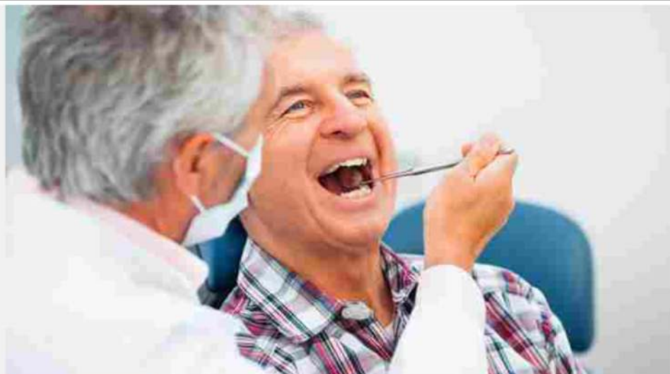
L'Istituto Stomatologico Italiano, impegnato dal 1908 a curare i denti dei milanesi, ha appena varato un'unità mobile odontoiatrica per la cura a domicilio dei pazienti.