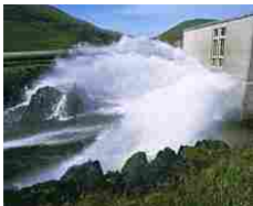
Vendono centrale idroelettrica eludendo il fisco, sequestro da 2,3