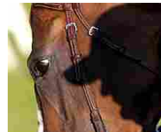
Orrore a Messina, stalliere abusa sessualmente di una