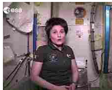
Ecco come fanno gli astronauti ad andare in bagno