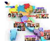
Amministrative 2015, speciale Adnkronos - A cura di Cristiana Deledda e Francesco Saita