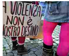
Voleva difendere la moglie da uno stupro di gruppo, ucciso a