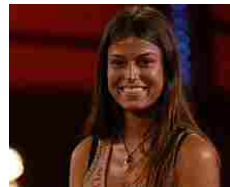
Dietrofront di Sara Tommasi: "Innamorata dell'avvocato Diprè, me