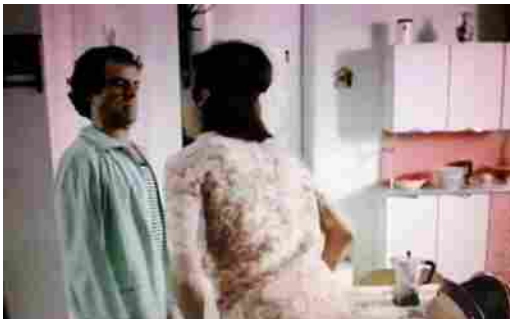
'Ti spunta un fiore in bocca...', celebre battuta dal film 'Febbre da cavallo' di Steno